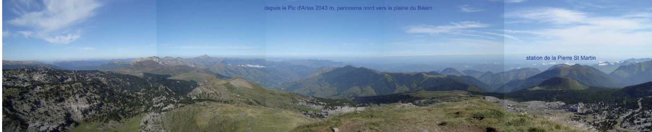
station de la Pierre St Martin

... et retrouvailles, le dimanche 13 août ! Avec l'arrivée de la relève !