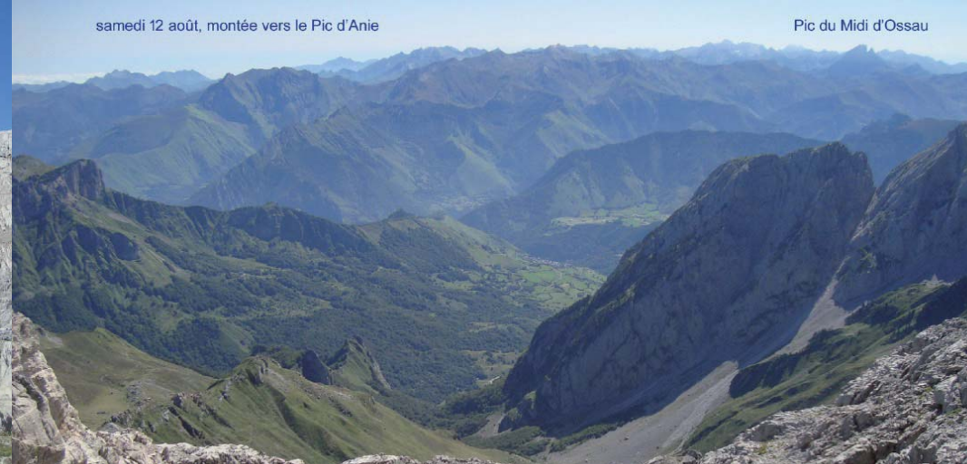
Pic du Midi d'Ossau